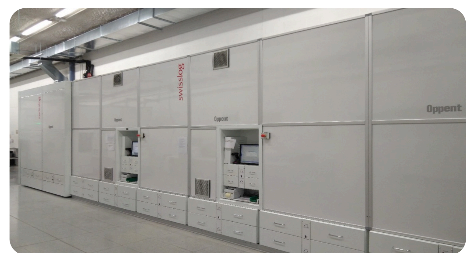
"LES NOSTRES PRESTATGERIES"