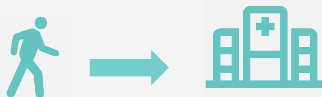
Servei de Farmàcia de l'Hospital

No hi ha medicament per a cap pacient. Es genera una alerta farmacèutica que es gestiona des de l'AEMPS (3) i s'autoritza la importació del medicament a través del Ministeri de Sanitat. La compra del medicament només la poden fer els Serveis de farmàcia dels hospitals. El pacient serà derivat al Servei de Farmàcia de l'hospital de referència.