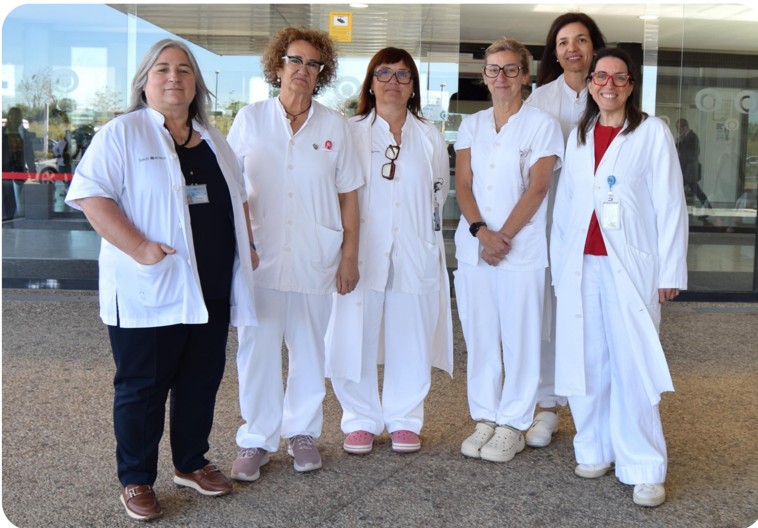
Professionals dels Serveis d'Otorrinolaringologia, Rehabilitació, Fisioteràpia i Logopèdia

Aquest any posem èmfasi als pacients laringectomitzats que gràcies a les pròtesis fonatòries poden recuperar la capacitat de comunicar-se mitjançant la parla.